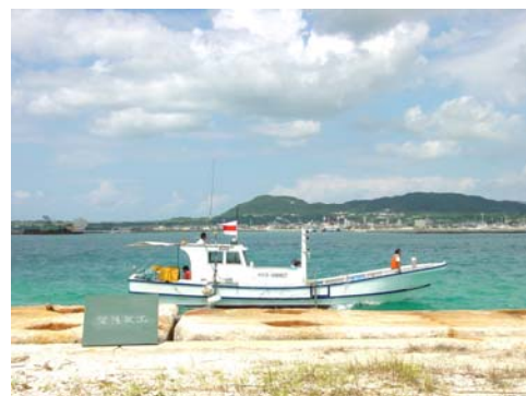
GPS 誘導による深浅測量状況