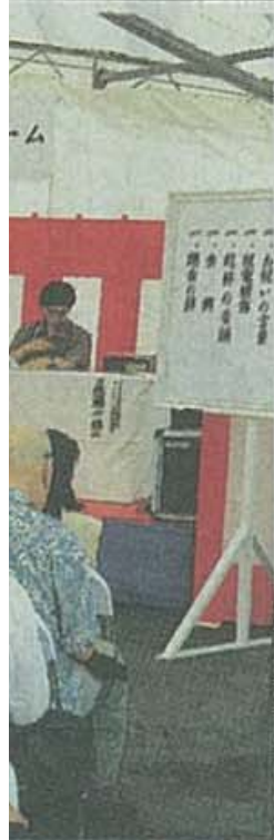
事業所の落成式 の同施設

【うるま】知的障害者入所施設「あすかホーム」の落成式が12日、うるま市石川の同施設で開